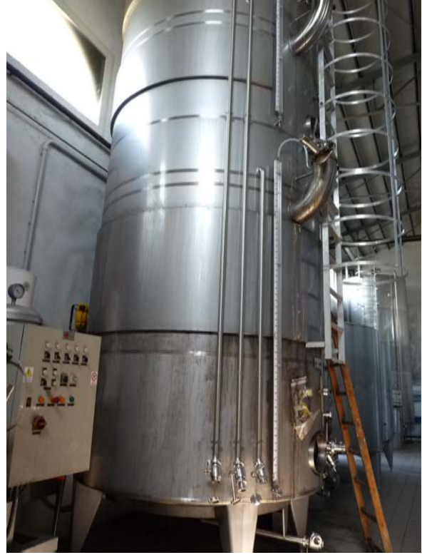
36A e 36B Vasche in acciaio inox refrigerate da 50 hl