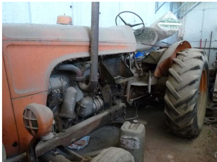
48 Trattore Fiat OM 513 R, 1 a immatricolazione 1963