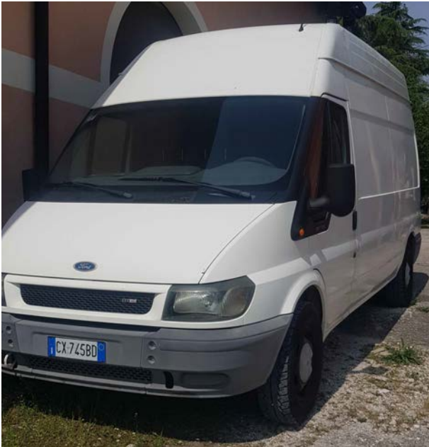
2A - Ford Transit 350 L. Van 2.0 colore bianco. Anno 1 a immatricolazione 2005. Scadenza revisione: 08.2023