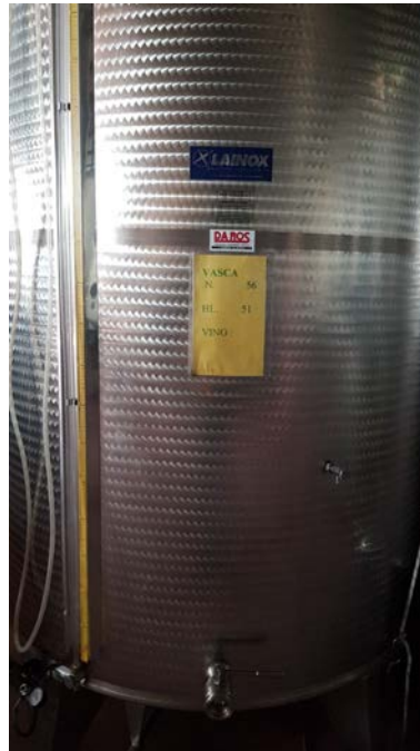
62 vasca inox capacità 50 hl