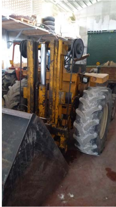
43 Carrello elevatore International 25 20C