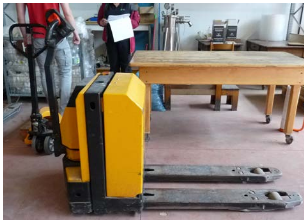
75 Transpallet elettrico Jungheinrich