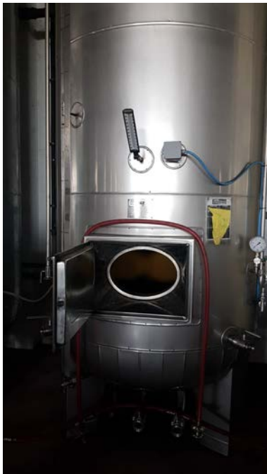
65 C-D autoclavi per spumantizzazione capacità 50 hl