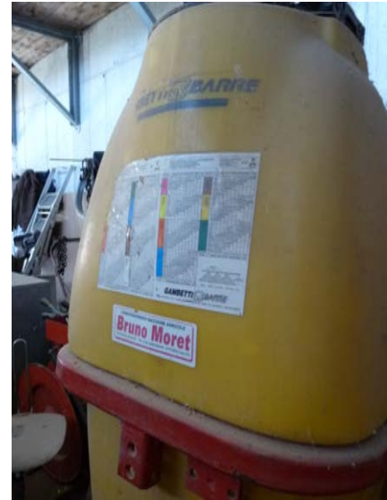
50 Botte per diserbo Modello Gambetti