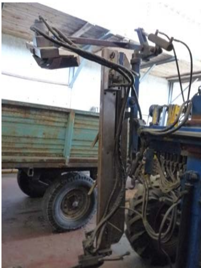
47 Tagliacavi VBC doppio filare a coltelli