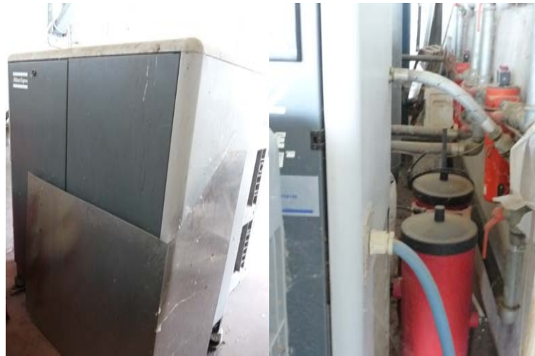
29 Compressore Atlas Copco con essiccatore e serbatoio d'aria Presente il pulsante di arresto di sicurezza