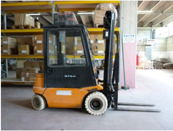
55 Muletto Still a batteria 80 volt con pneumatici antitraccia