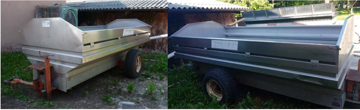
16 Carro per raccolta uva con scaricatore posteriore in acciaio inox produttore Friuli