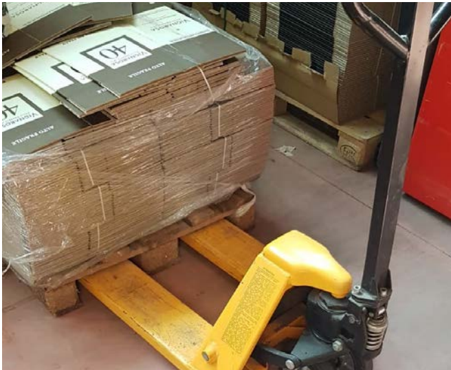
73 Transpallet manuale