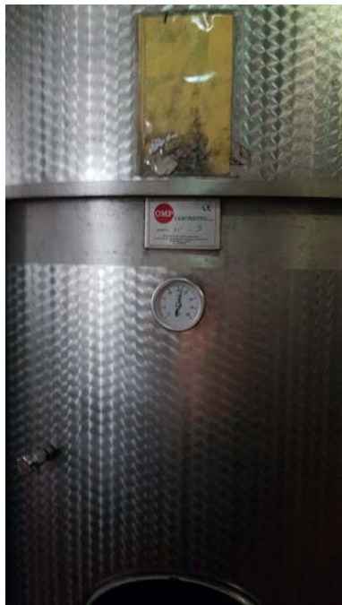
60 A-B vasche inox refrigerate a glicole con doppia parete per cooling, capacità 150 hl