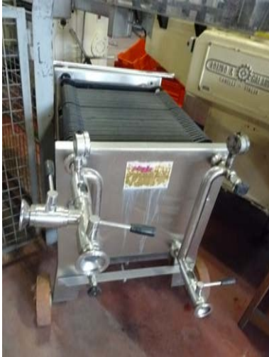
68 filtro a cartoni Velo