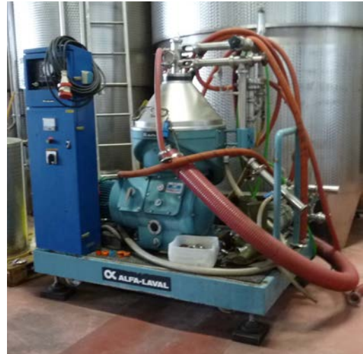
71 Centrifuga da vino Alfa Laval acquisto 1990 isobarica a tenuta meccanica