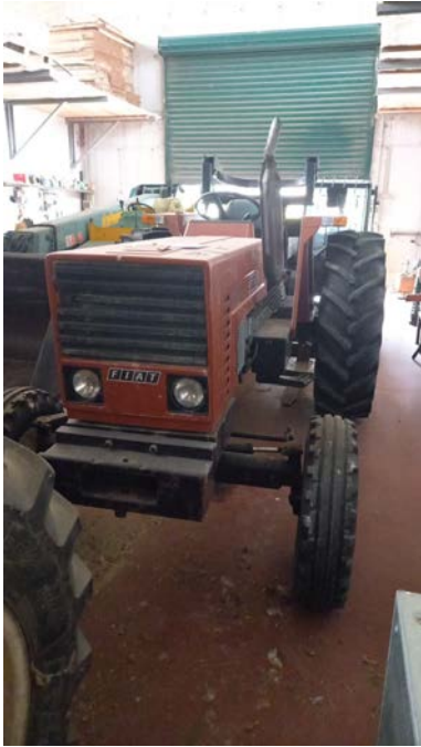
42 Trattore Fiat 670 con rollbar targa TV44681 1 ^ immatricolazione 1982