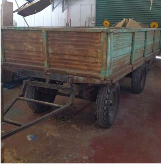
17C Rimorchio agricolo Moro