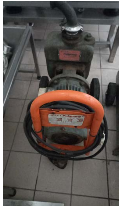
41C Pompa Pulipomp per lavaggio vasche