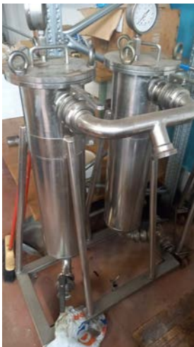
74B filtro a sacco doppio