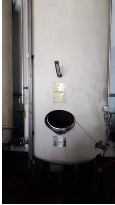
65 A-B autoclavi per spumantizzazione in ferro smaltato capacità 50 hl