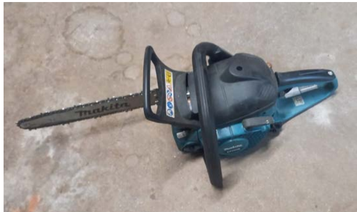
12B Motosega Makita EA3200S 350mm