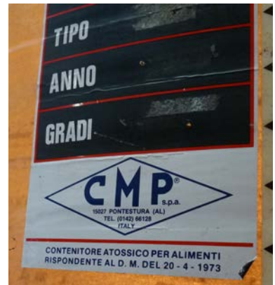
4 A-B-C-D-E : vasche in vetroresina per alimenti con sistema troppopieno, capacità 45 hl le prime quattro, capacità 30 hl l'ultima ("39" nella foto).