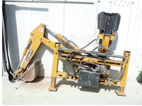
54 Retroescavatore Argnani e Monti