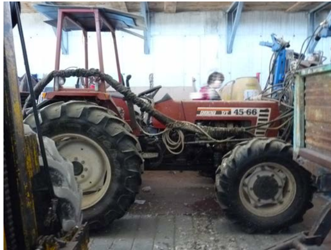
46 Trattore Fiat 45 66 DT12, 1 a immatricolazione 1990