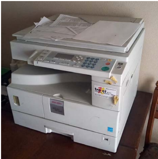
14 Stampante multifunzione Ricoh