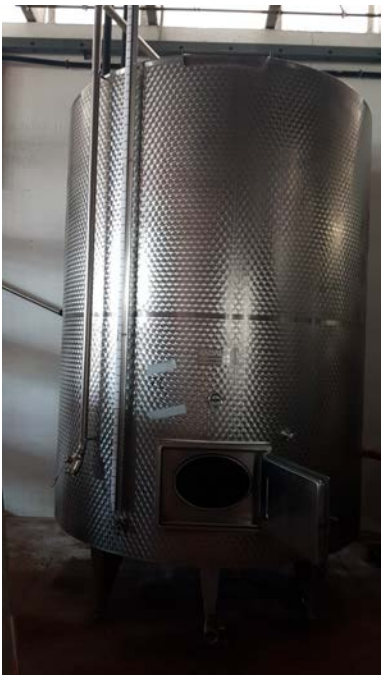
59 vasca inox refrigerata a glicole con doppia parete per cooling, capacità 100 hl