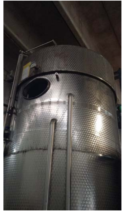
58 A-B-C-D n.4 vasche inox refrigerate a glicole con doppia parete per cooling, capacità 25 hl