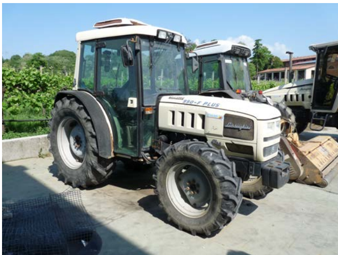
52 Trattore Lamborghini 990 F plus da frutteto 90 cv