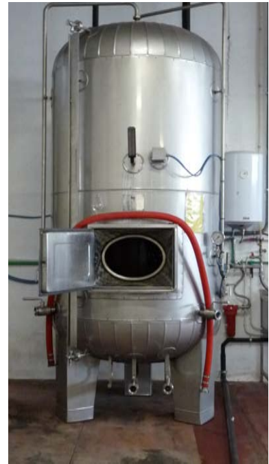
66 B-C-D autoclavi per spumantizzazione capacità 25 hl, le prime due in ferro smaltato