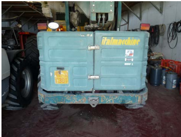
45 carrello elevatore Italmacchine Lift 2507 1 ^ immatricolazione 1995