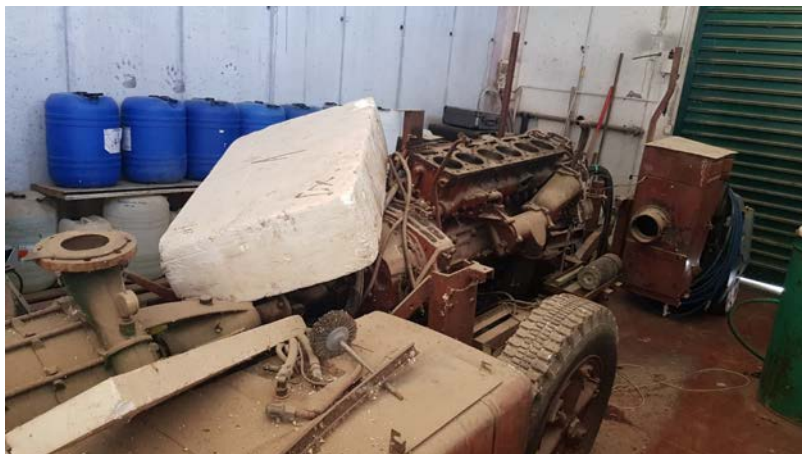
49 Motore Cumins per acqua irrigazione con pompa Caprari smontato