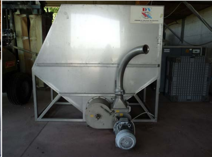
26 Vasca di raccolta uve. In acciaio inox con pompa incorporata, lunghezza 6 m. Anno di fabbricazione 2011. matricola 1235/11. Marchiata CE