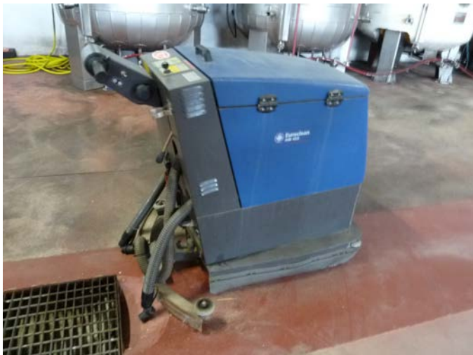
70 Lavapavimenti Euroclean AW 455 T