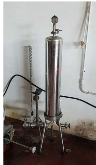
76 filtro a cartuccia per microfiltrazione