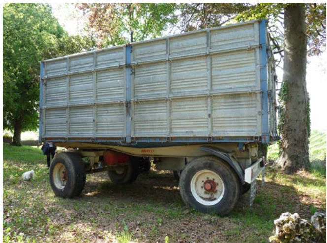
19 Rimorchio agricolo due assi Pavelli targato TV23634 immatricolato il 16.04.1996. Cassone ribaltabile su tre lati a doppia sponda h 150 cm. Con presa di potenza. Portata 140 q