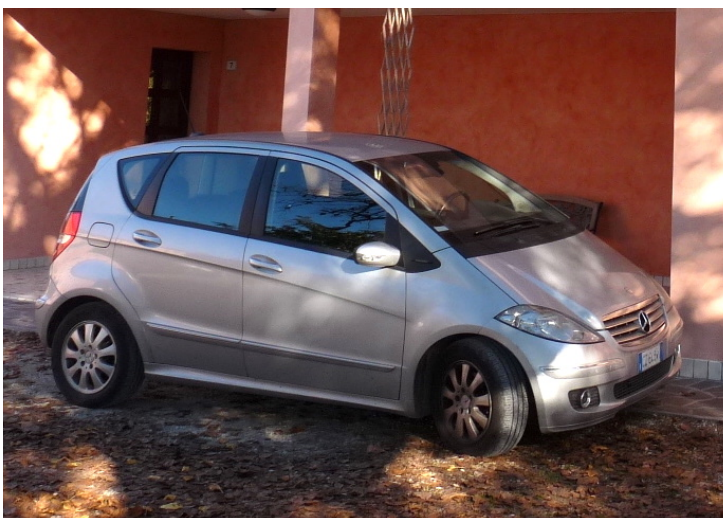
80 Mercedes Benz Mod. A 180 CDI 2.0 colore grigio chiaro metallizzato Anno 1 a immatricolazione 2006. Scadenza revisione: 06.2023