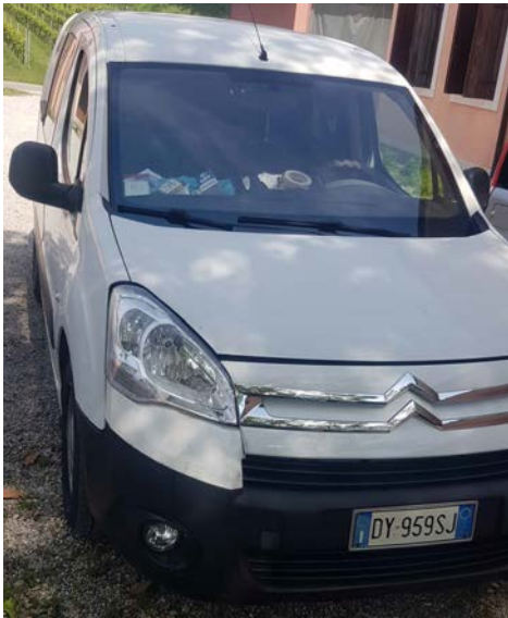
79 Citroen Berlingo autocarro colore bianco. Anno 1 a immatricolazione 2005. Scadenza revisione: 05.2024