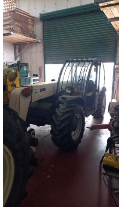
44 carrello elevatore telescopico Terexlift Gladiator 3007, 1 ^ immatricolazione 2009