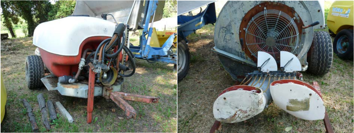
23 Nebulizzatore Friuli. Controllo irroratrici Regione Veneto 2018