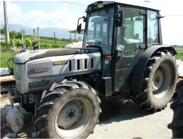
53 Trattore Hurlimann XF 90 cv da frutteto