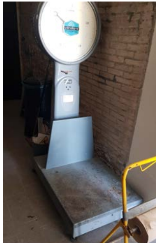
10 Bilancia Vandoni matr. 1252. In uso