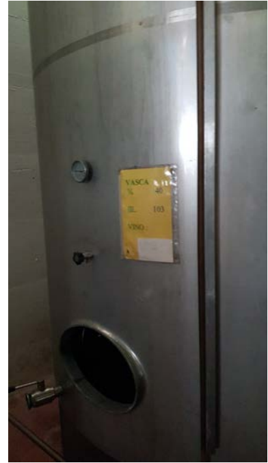
63A vasca inox capacità 100 hl