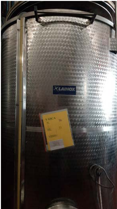
61 vasca inox con sistema semprepieno, capacità 30 hl