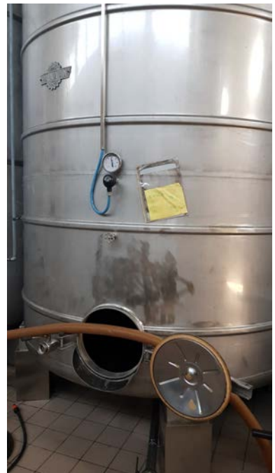
33 A-B-C: Vasche in acciaio inox AISI 316 (con Molibdeno) refrigerate Ditta Padovan modificate per uso enologico