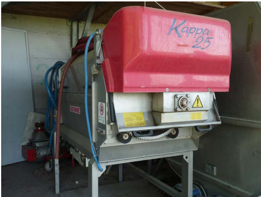
27 Diraspa Pigiatrice Kappa 25 Ditta Diemme anno di costruzione 2004 matricola C 224 159 marchiata CE. In acciaio inox AISI 304 e completa di Gabbia e battitore mossi a mezzo inverter installato all'interno del quadro elettrico. Capacità di lavoro 250 q/ora, predisposta per lavorare in continuo e in automatico.