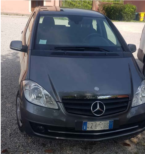
1A - Mercedes Benz Mod. A 160 CDI colore grigio scuro metallizzato. Anno 1 a immatricolazione 2010. Scadenza revisione: 01.2023