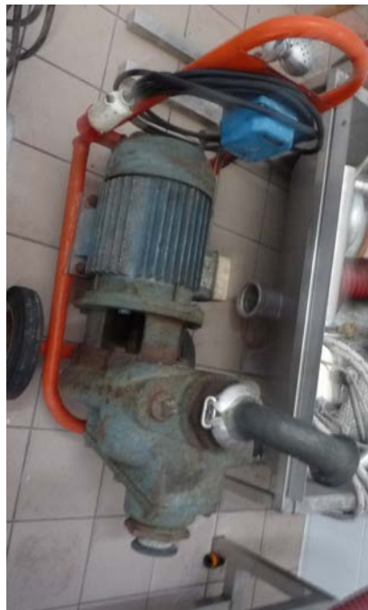
41B Pompa centrifuga da travaso Ditta Liverani portata 180 hl/ora