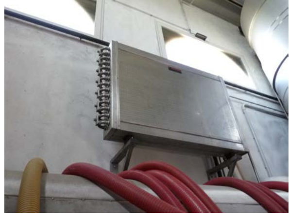
40 Scambiatore acqua-vino Ditta Rossetto