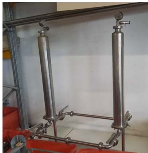
74C filtro a cartuccia per microfiltrazione