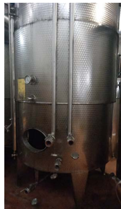
57 A-B-C-D n. 4 vasche inox refrigerate a glicole con doppia parete per cooling, capacità 50 hl