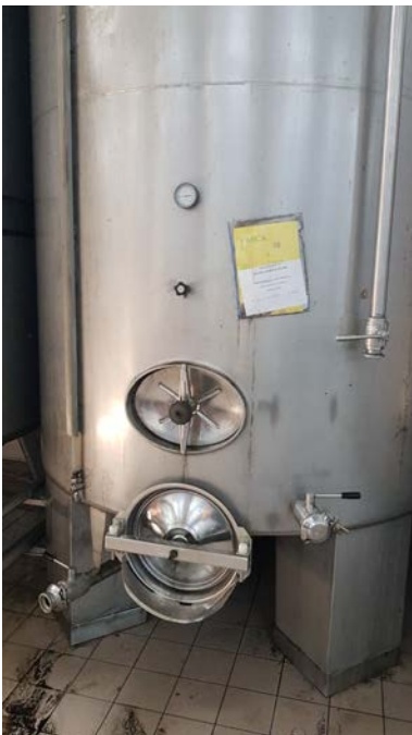
35B Vasca in acciaio inox refrigerata da 100 hl