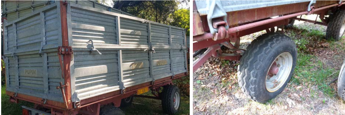
20 Rimorchio agricolo due assi Pupin RT40 targato AJ638X immatricolato nel 1985. Cassone ribaltabile su tre lati a doppia sponda alta 100 cm. Con presa di potenza. Portata 40 q