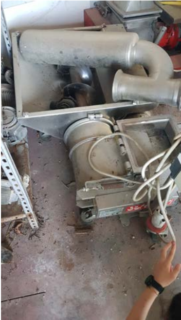
28 Pompa per uva Strazzari