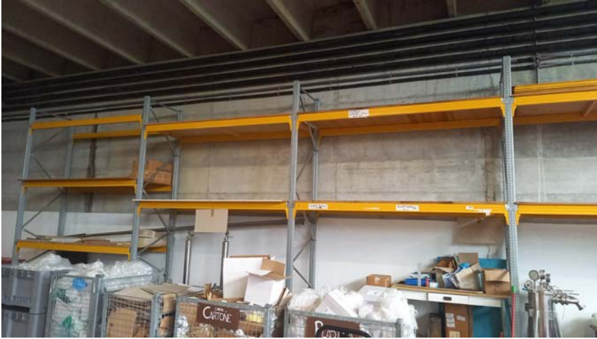
77 n. 10 scaffalature da capannone