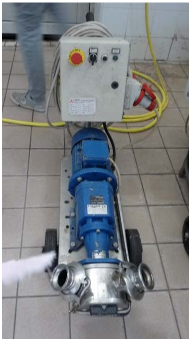
41A Pompa centrifuga da travaso Ditta Liverani portata 180 hl/ora dotata di inverter