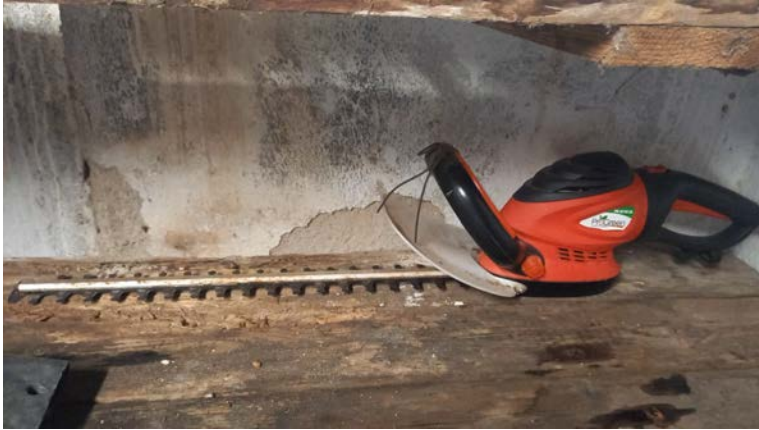
13 Tagliasiepi elettrico 710W ProGreen Mod. PG 6170 EL