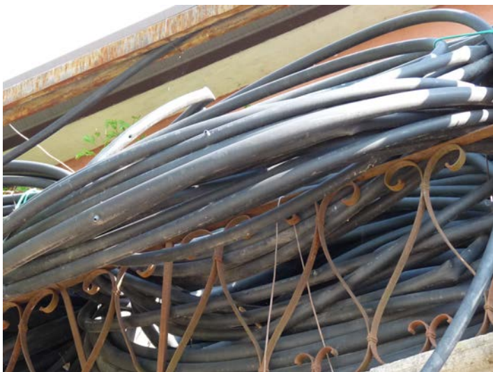
15 Ala gocciolante in polietilene stimate circa 35 bobine da 400 m. Conservate all'aperto