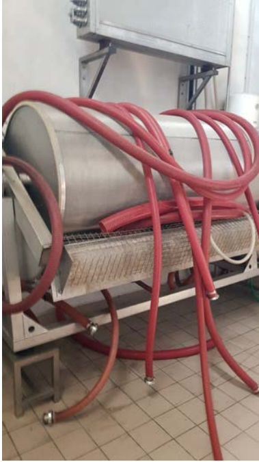
39 Filtro a farina fossile sottovuoto Ditta Padoan. Anno di costruzione 2000 marchiato CE