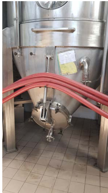
34B Vasca in acciaio inox da 150 hl. Vinificatore con fondo a becco di luccio per estrazione manuale