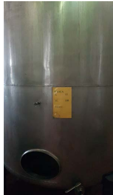
63 B-C-D vasche inox capacità 100 hl