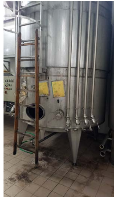
35A Vasca in acciaio inox refrigerata da 100 hl