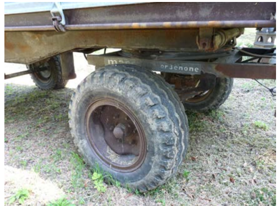
18 Rimorchio agricolo due assi Moro targato TV13670 immatricolato il 01.03.1979 con libretto UMA. Ribaltabile su tre lati a doppia sponda alta 120 cm. Con presa di potenza