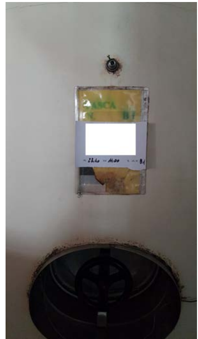
66A autoclave in ferro smaltato capacità 25 hl