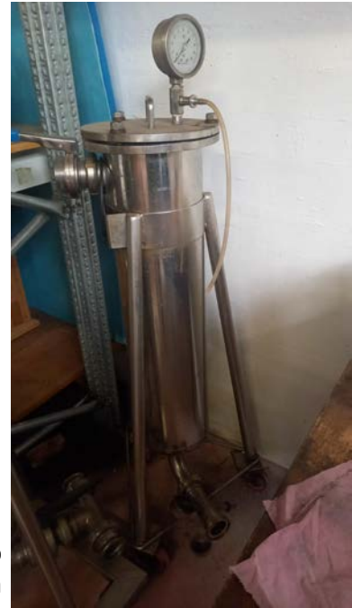
74A filtro a sacco o a manica