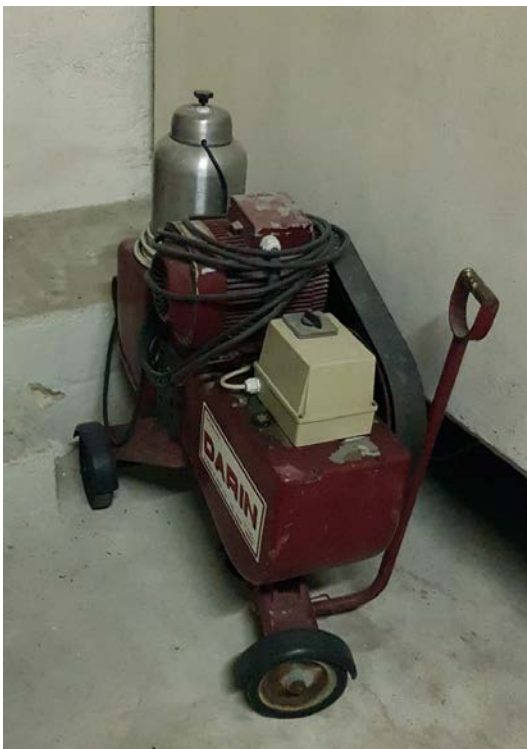
7A Pompa a pistoni Darin matr. MH112C-2/4 50. Produzione 1980-1989 circa.