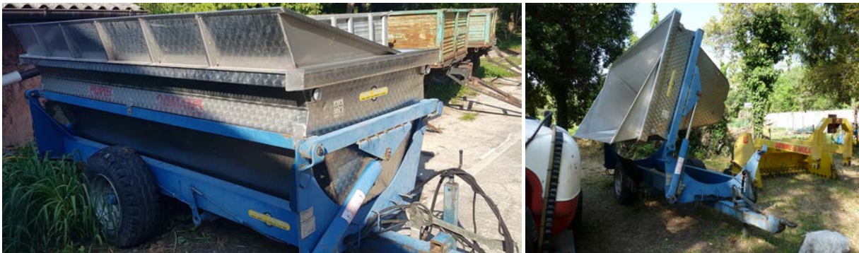
21 Carro da vendemmia monoasse Pupin 35VG 30N55 targato AE748H immatricolato nel 2005. Cassone ribaltabile laterale. Portata 35 q