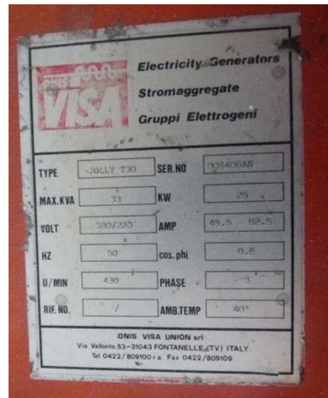
51 Gruppo elettrogeno VISA da 30 kW da attaccare alla pdp del trattore