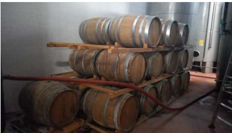
72 n. 25 barriques da 2,25 hl, da arredo