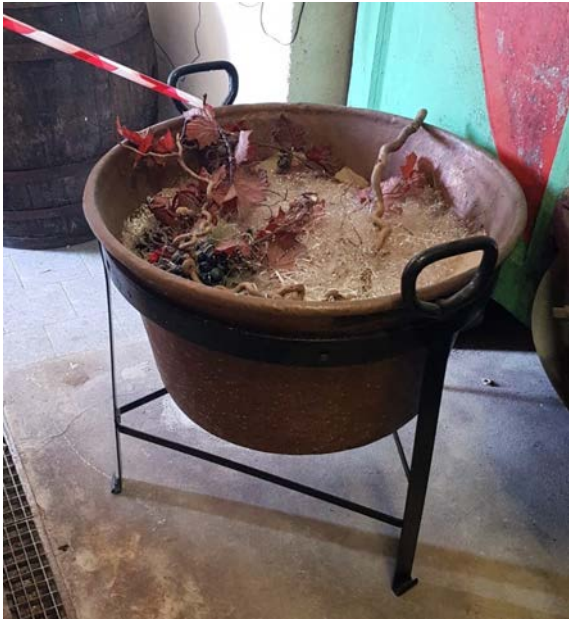
8 Caliera in rame con treppiede. Diametro sup 75 cm, altezza 44 cm