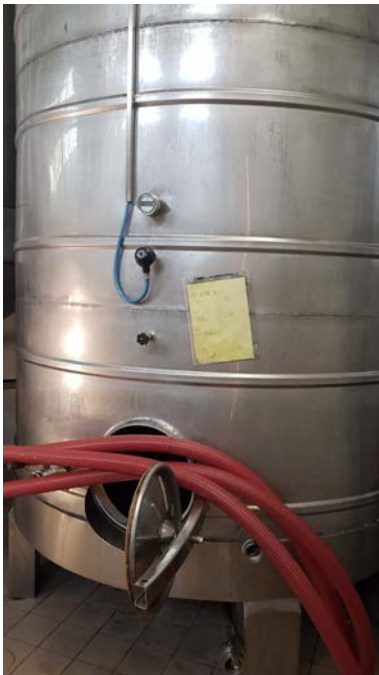
34A Vasca in acciaio inox refrigerate da 150 hl