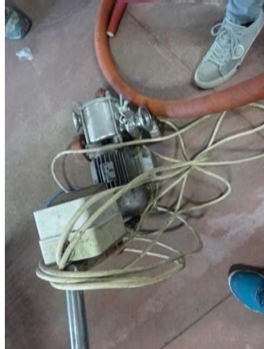
69A pompa centrifuga Mencarelli inox con motore elettrico Rotos 25hl/ora