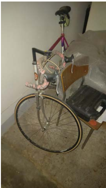
11 Bicicletta da corsa Aurora