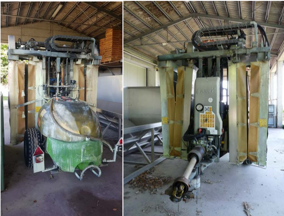
25 Atomizzatore a recupero Friuli capacità 20 hl. Recupero stimato in 30-35% sul distribuito