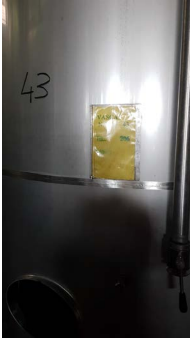
64 vasca inox capacità 300 hl