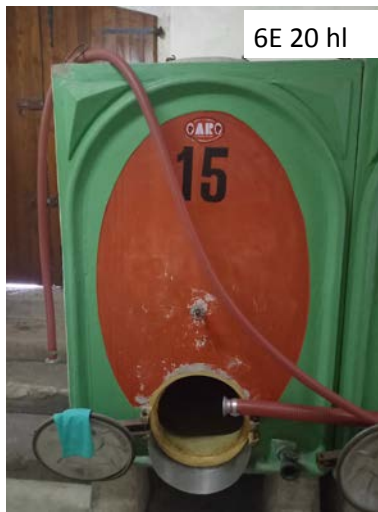
6A-B-C-D-E. Vasche in cemento vetrificato. Non in uso. Capacità 25 hl, l'ultima ha capacità 20 hl ("15" nella foto)