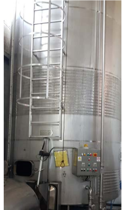
32 A-B-C: Vasche in acciaio inox refrigerate. Sistema cooling a biscotto con glycole. Capacità 250 hl ciascuna. La 32C ha tasche di raffreddamento (non coibentate), fondo conico con estrazione a pale automatica e irroratore per i rimontaggi, per vinificazione