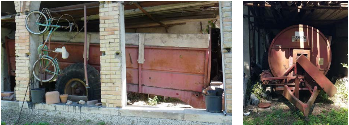
24 Spandiletame Annovi. In disuso