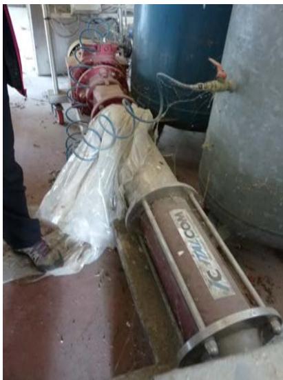
30 Pompa orizzontale Italcon Mod. Sigma 38 TV matricola 5559. Marchiata CE