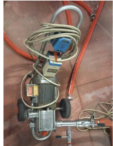
69B pompa centrifuga Mencarelli con motore Electro Adda