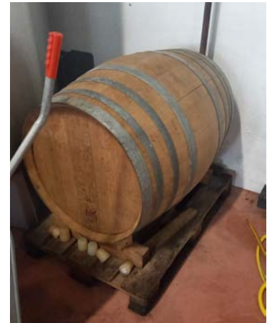
72 n. 1 barrique da 3,5 hl