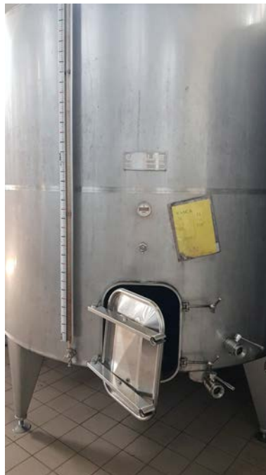
35C e 35D Vasche in acciaio inox refrigerate da 100 hl della Ditta Cadalpe, a fondo piano leggermente inclinato verso il boccaporto a raso. Utilizzabili per vinificazione in rosso con estrazione manuale