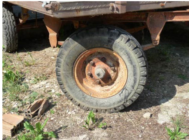
17A Rimorchio agricolo Moro targato TV3118 immatricolato il 12.06.1976 con libretto UMA