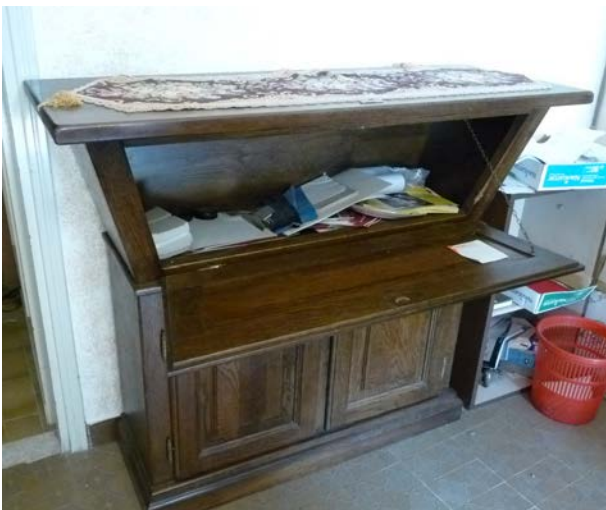
3A - madia in legno con anta ribaltabile e n. 2 ante piene