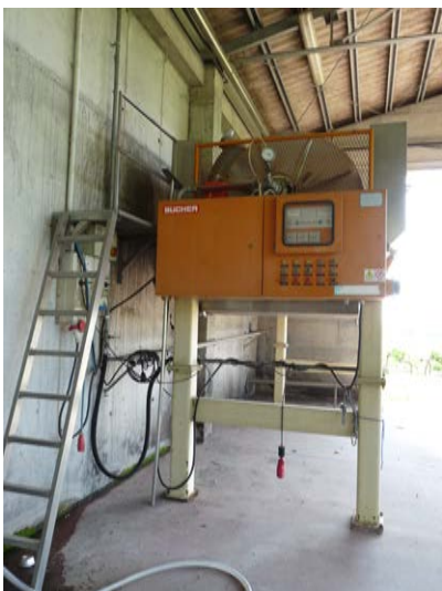
31 Pressa da vendemmia BucherVaslin Ditta Friulmeccanica Anno di costruzione 1988 Matricola 152/88